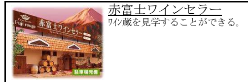
赤富士ワインセラー ワイン蔵を見学することができる。