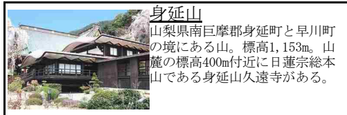
身延山 山梨県南巨摩郡身延町と早川町の境にある山。標高1,153m。山麓の標高400m付近に日蓮宗総本山である身延山久遠寺がある。