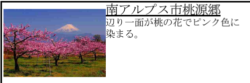
南アルプス市桃源郷 辺り一面が桃の花でピンク色に染まる。

バス ≡ 車 ≡ JR ≡ 私鉄 ≡ 船 ≡ 飛行機 ≡ ロープウェイ ≡ ケブルカー ≡ 徒歩 ≡